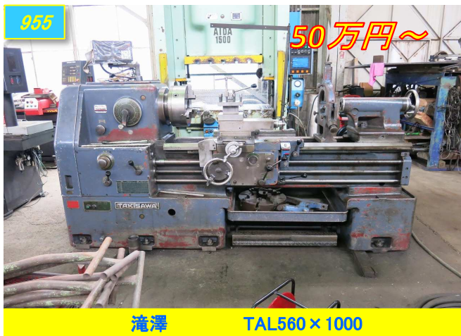
滝澤 TAL560 x 1000