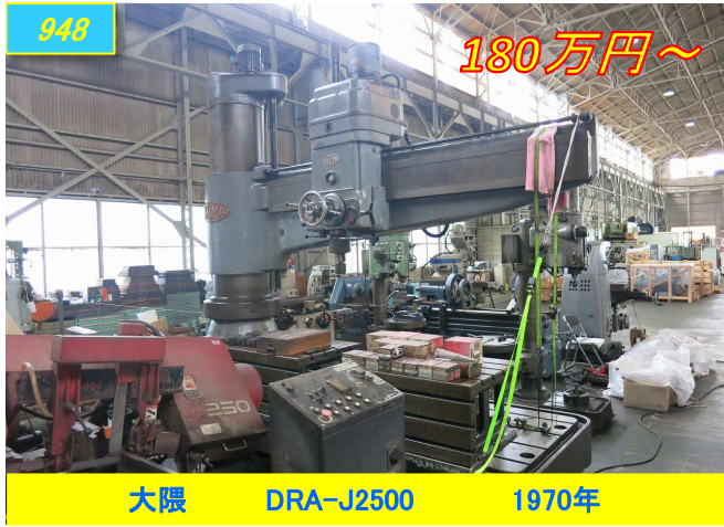
大隈 DRA-J2500 1970年