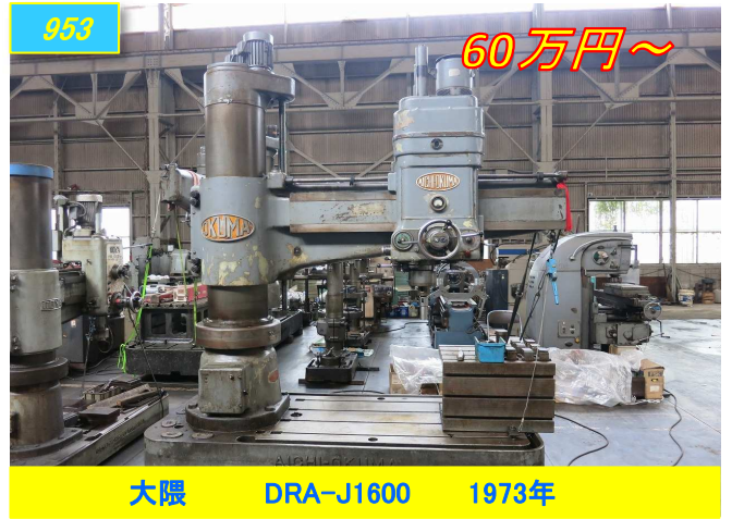
大隈 DRA-J1600 1973年