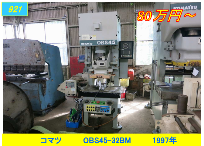
コマツ OBS45-32BM 1997年