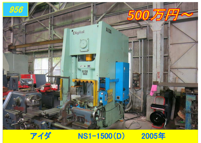
アイダ NS1-1500(D) 2005年