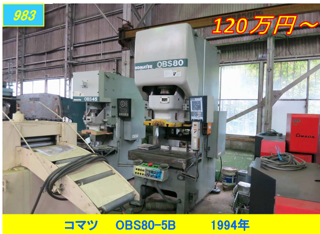
コマツ OBS80-5B 1994年