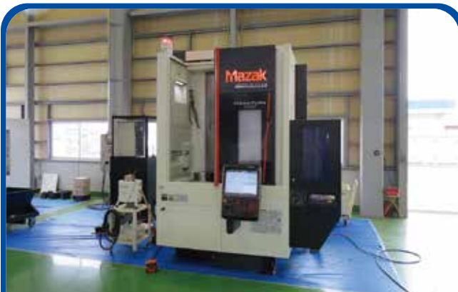
立形NC旋盤(ヤマザキマザック) (高崎) 2017年 MEGATURN 500M 1380万円 制御 Smooth G 税込1518万円