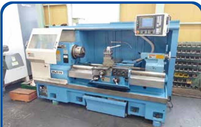
フラット形NC旋盤(大日金属) (名古屋) 2010年 DL530×100 450万円 制御 FANUC-20iTB 税込495万円