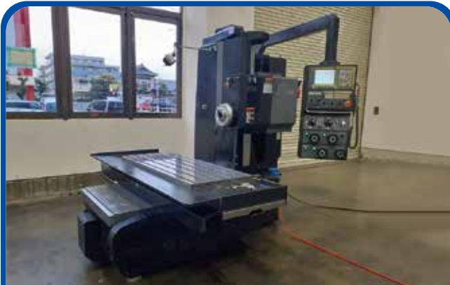
NC横形フライス盤(山崎技研) (足立) 2019年 YZB-88SG 1500万円 制御 FANUC-Oi-MF 税込1650万円