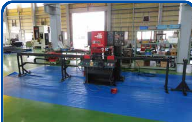
NCアイアンワーカー (アマダ) (高崎) 1996年 IW-45II 178万円 税込195.8万円