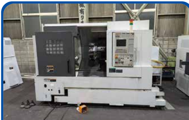
ドラム形NC旋盤(森精機) (大阪) 2010年 NL2500/700 698万円 制御 MSX-850IV 税込767.8万円