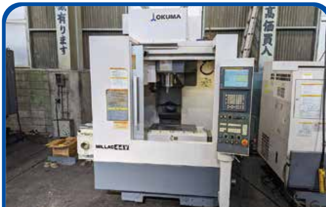
#40立形マシニングセンタ(オークマ) (大阪) 2006年 M-44V 295万円 制御 FANUC-18i-MB 税込324.5万円