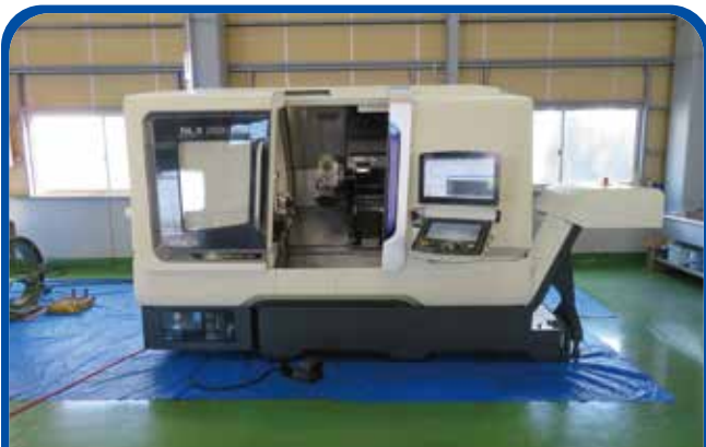
ドラム形NC旋盤(DMG森精機) (高崎) 2018年 NLX2500Y/700 1600万円 制御 CELOS(M730BM) 税込1760万円