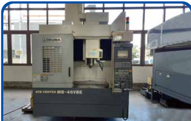
#50立形マシニングセンタ(オークマ) (足立) 2005年 MB-46VBE 400万円 制御 OSP-E100M 税込440万円