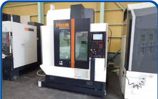
#40立形マシニングセンタ(ヤマザキマザック) (名古屋) 2017年 VCN-430A 800万円 制御 SmoothC 税込880万円