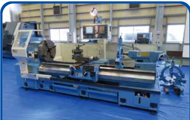
フラット形NC旋盤(大日金属) (高崎) 2006年 DL65×200 580万円 制御 FANUC-20i-TB 税込638万円