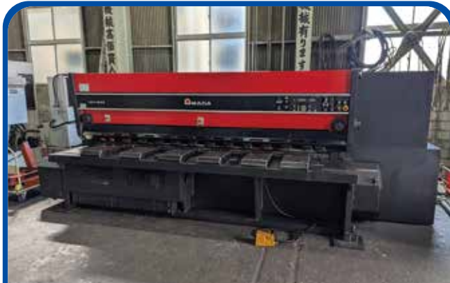
3000mm×13mmメカシャー (アマダ) (大阪) 1996年 DCT-3013 395万円 税込434.5万円