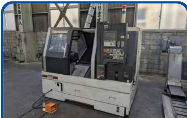
ドラム形NC旋盤(森精機) (大阪) 2006年 DuraTurn2550 375万円 制御 MSC-504 税込412.5万円