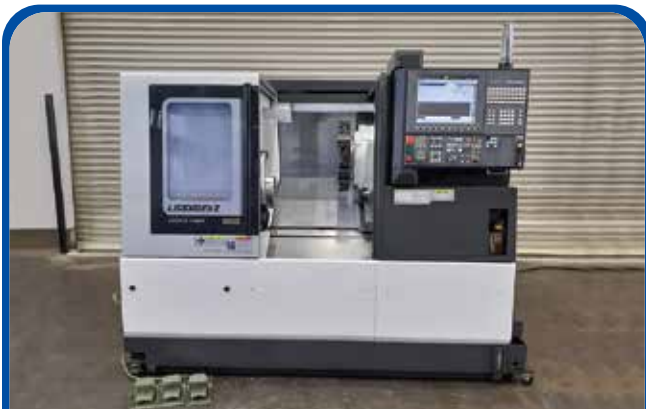
ドラム形NC旋盤(オークマ) (足立) 2018年 LB3000EXII 780万円 制御 OSP-P300LA 税込858万円