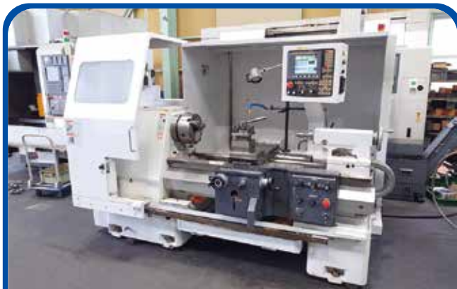
フラット形NC旋盤(滝澤鉄工所) (名古屋) 2019年 TAC-510L10 680万円 制御 FANUC-32i-MB 税込748万円