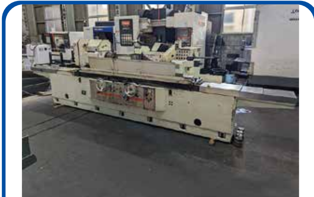
1500mm円筒研削盤 (シギヤ精機) (大阪) 2006年 GP-40B-150A 430万円 税込473万円