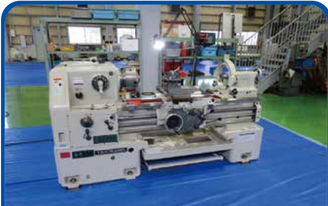
7尺普通旋盤 (滝澤鉄工所) (高崎) 2005年 TAL510×1000 360万円 税込396万円