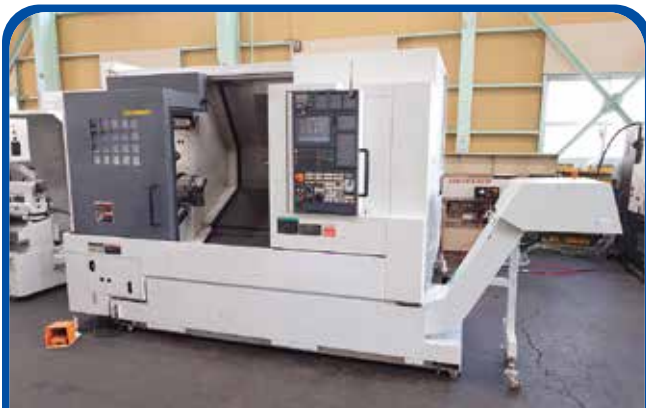
ドラム形NC旋盤(森精機) (名古屋) 2008年 NL2500/700 728万円 制御 MSX-850III 税込800.8万円