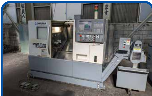
ドラム形NC旋盤(オークマ) (大阪) 2008年 LB3000EX 600万円 制御 OSP-P200L 税込660万円