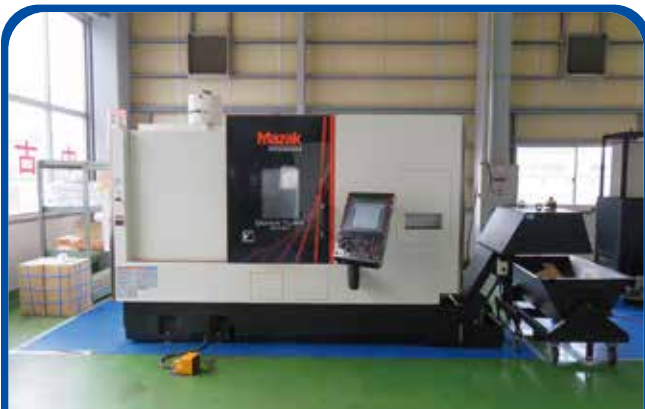
ドラム形NC旋盤(ヤマザキマザック) (高崎) 2016年 QT-350MY 1480万円 制御 Smooth G 税込1628万円