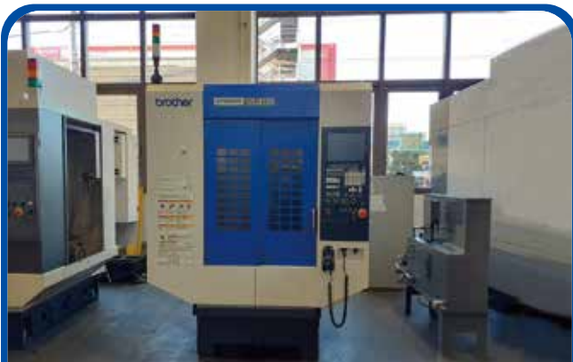
#30立形マシニングセンタ(ブラザー) (足立) 2017年 S500X1 430万円 制御 CNC-C00 税込473万円