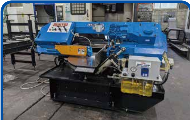
250mm全自動バンドソー (大阪) (大東精機) 220万円 2017年 LTAⅡ2640 税込242万円