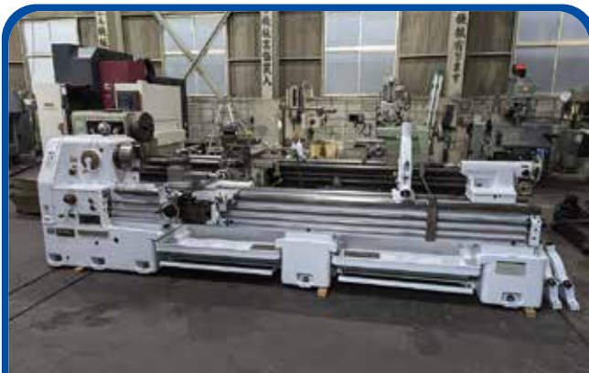
14尺普通旋盤 (大阪) (滝澤鉄工所) 400万円 2005年 TAL600×3000 税込440万円