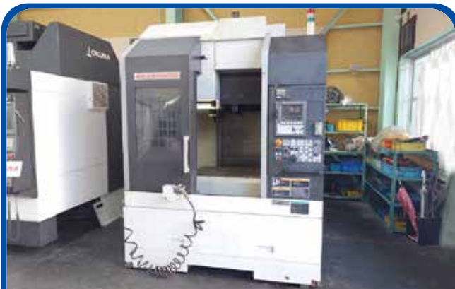
#40立形マシニングセンタ(森精機) (名古屋) 2007年 DuraVertical5060 400万円 制御 MSC504 税込440万円