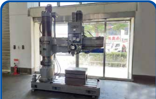
1400mmラジアルボール盤 (足立) (小川鉄工) 280万円 2001年 HOR-D1400 税込308万円