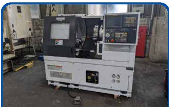
ドラム形NC旋盤(滝澤鉄工所) (大阪) 2008年 TC-350L5 制御 FANUC-21i-TB 395万円 税込434.5万円