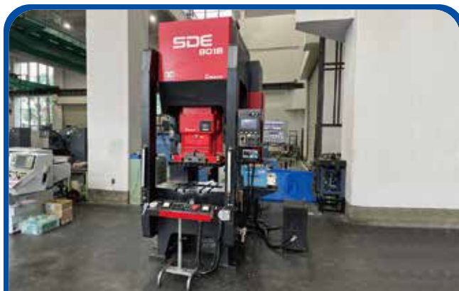
80トンサーボプレス (足立) (アマダ) 2004年 SDE8018 420万円 税込462万円