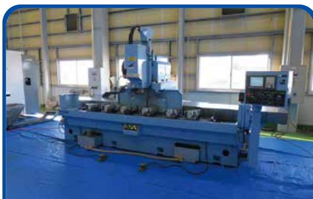
長尺NC加工機(イワシタ) (高崎) 2013年 IAM3330 制御 FANUC-OiMD 680万円 税込748万円