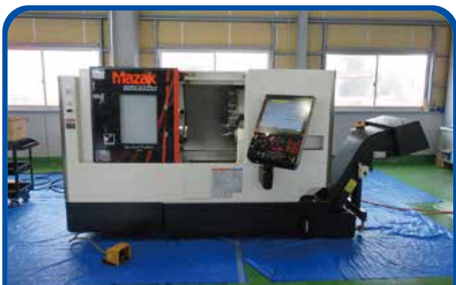
ドラム形NC旋盤(ヤマザキマザック) (高崎) 2020年 QT-200 制御 Smooth G 780万円 税込858万円