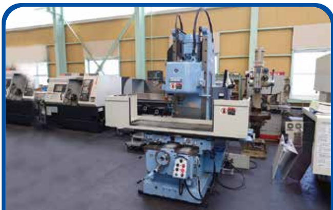
#3ベッド形立フライス盤 (名古屋) (OKK) 2013年 MH-3V 350万円 税込385万円