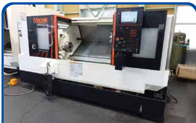
ドラム形NC旋盤(ヤマザキマザック) (名古屋) 2018年 QT250 制御 SmoothC 800万円 税込880万円