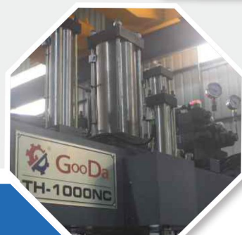
強力油圧シリンダー Powerful hydraulic cylinder