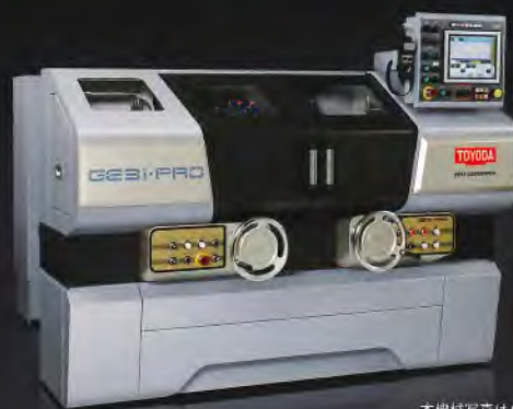
本機様写真はGE3Pi-25PROです。 本写真はフルカバー仕様(特別付属)です。