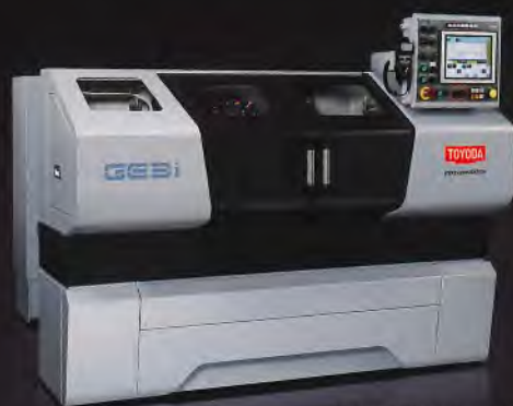
本機様写真はGE3Pi-25です。 本写真はフルカバー仕様(特別付属)です。