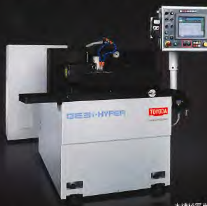
本機様写真はGE3Pi-25HYPERです。